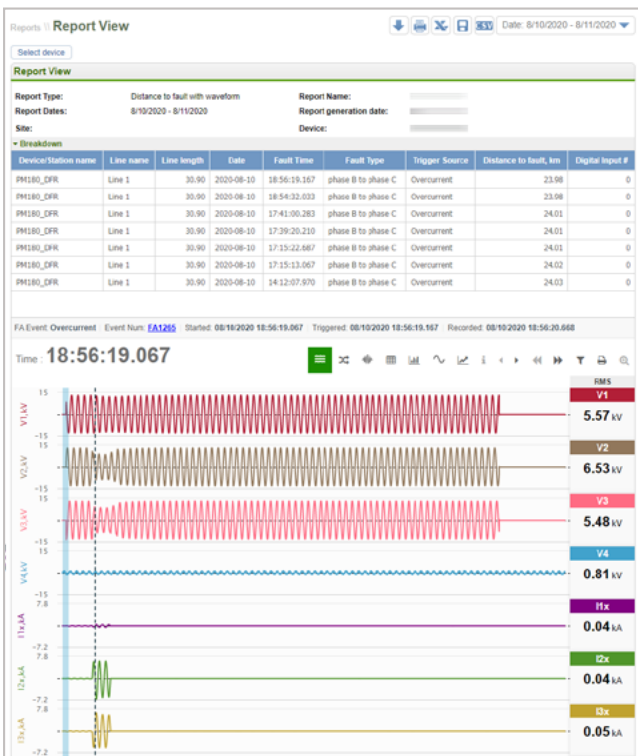
Reportes detallado de distancia de falla con forma de onda