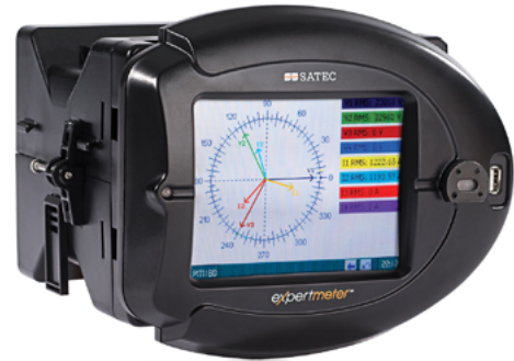
Analizador de Calidad de Energía PM180

Para darle respuesta a esta necesidad SATEC ofrece una plataforma integral, hardware y software. Este sistema luego es ajustado para adaptarlo al requerimiento local.