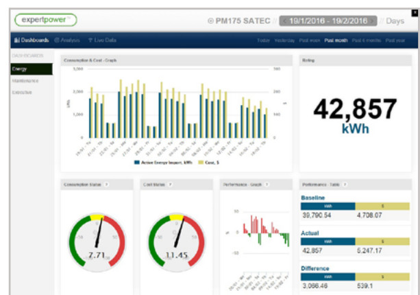
Dashboard para Eficiencia Energética